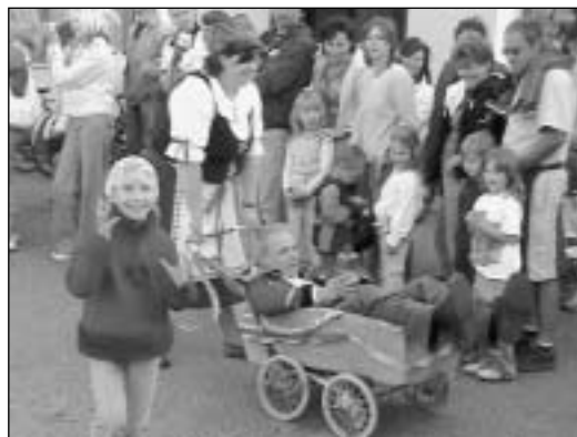
I takové jsou Máje. ▶