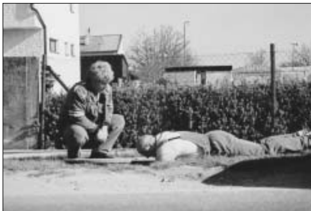
Údržba podtlakové kanalizace není vždy snadná.