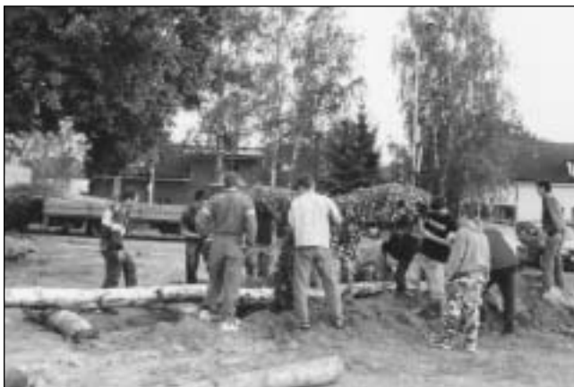
Příprava věnce na hlavní májku.