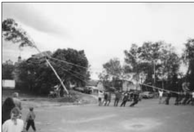
Zvedání hlavní májky.