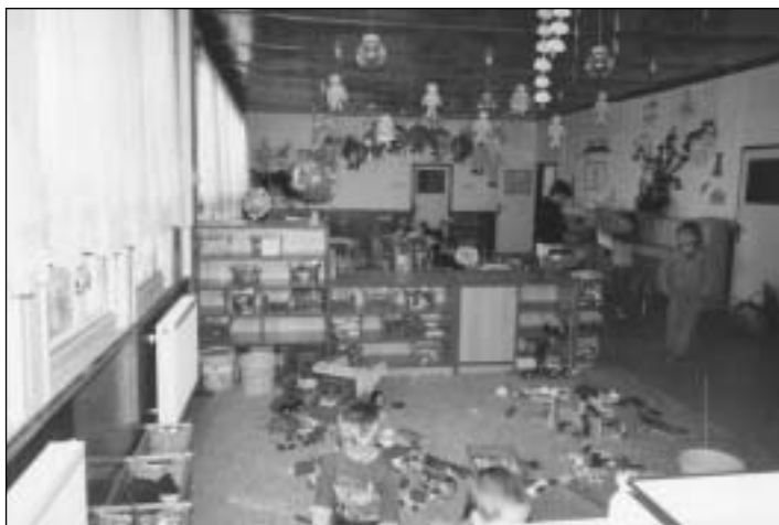
Mateřská škola je vybavena novým nábytkem.