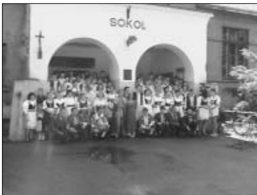
◀ Máje 2007 - před Sokolovnou.