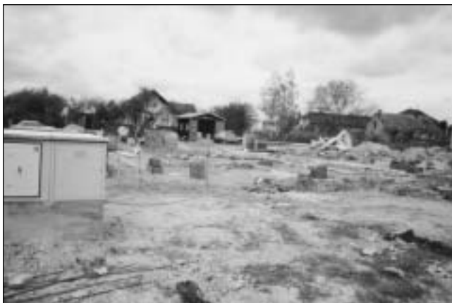
V jižní části obce vyrůstá nových 39 domů.